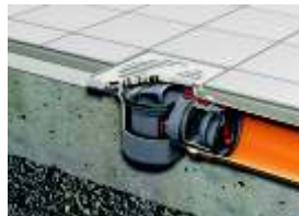
Kellerablauf mit herausnehmbarem Rückstauverschluss

Aufgrund des optimierten Abflussverhaltens erreicht der Kellerablauf mit Rückstauverschluss eine Abflussleistung von 1,6 l/s. Zudem lassen sich die Einbauteile werkzeuglos entnehmen und einfach reinigen.