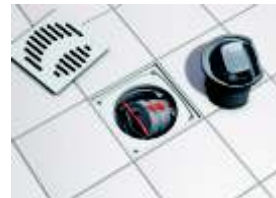
Zur einfachen Reinigung von Rohrleitung und Rückstauverschluss lässt sich dieser mit dem roten Handhebel leicht herausnehmen.